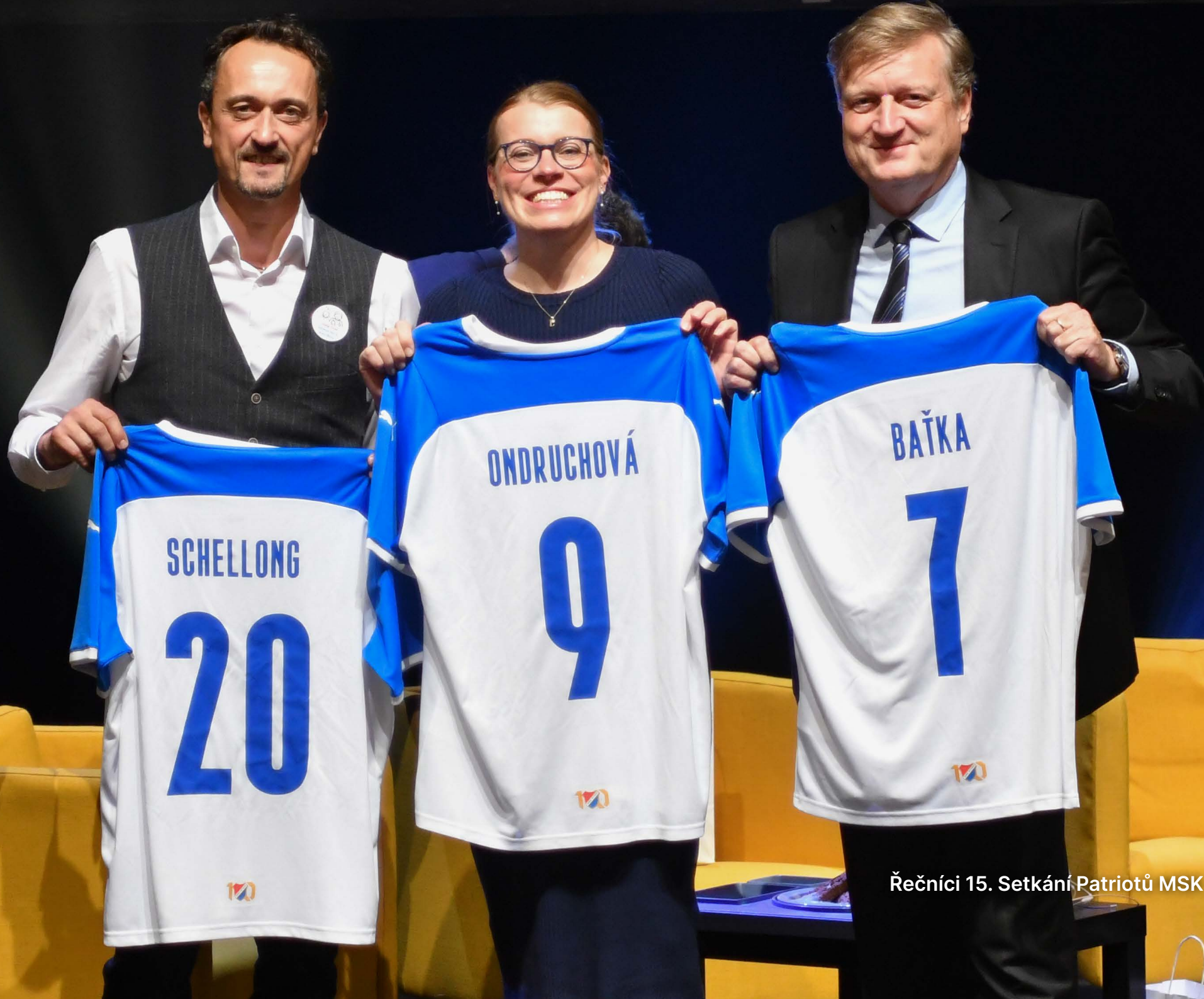
Řečníci 15. Setkání Patriotů MSK