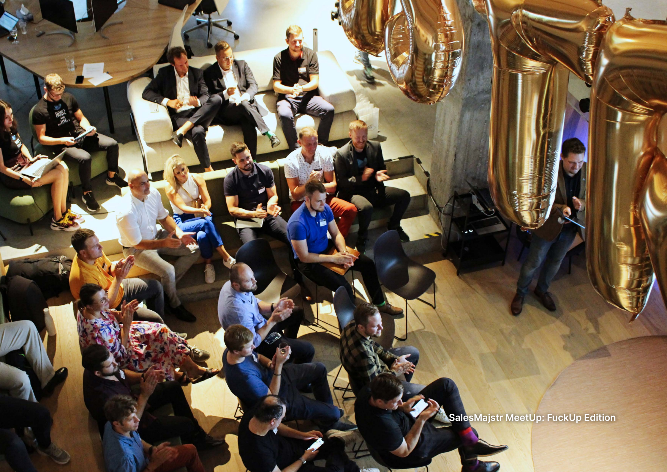
SalesMajstr MeetUp: FuckUp Edition