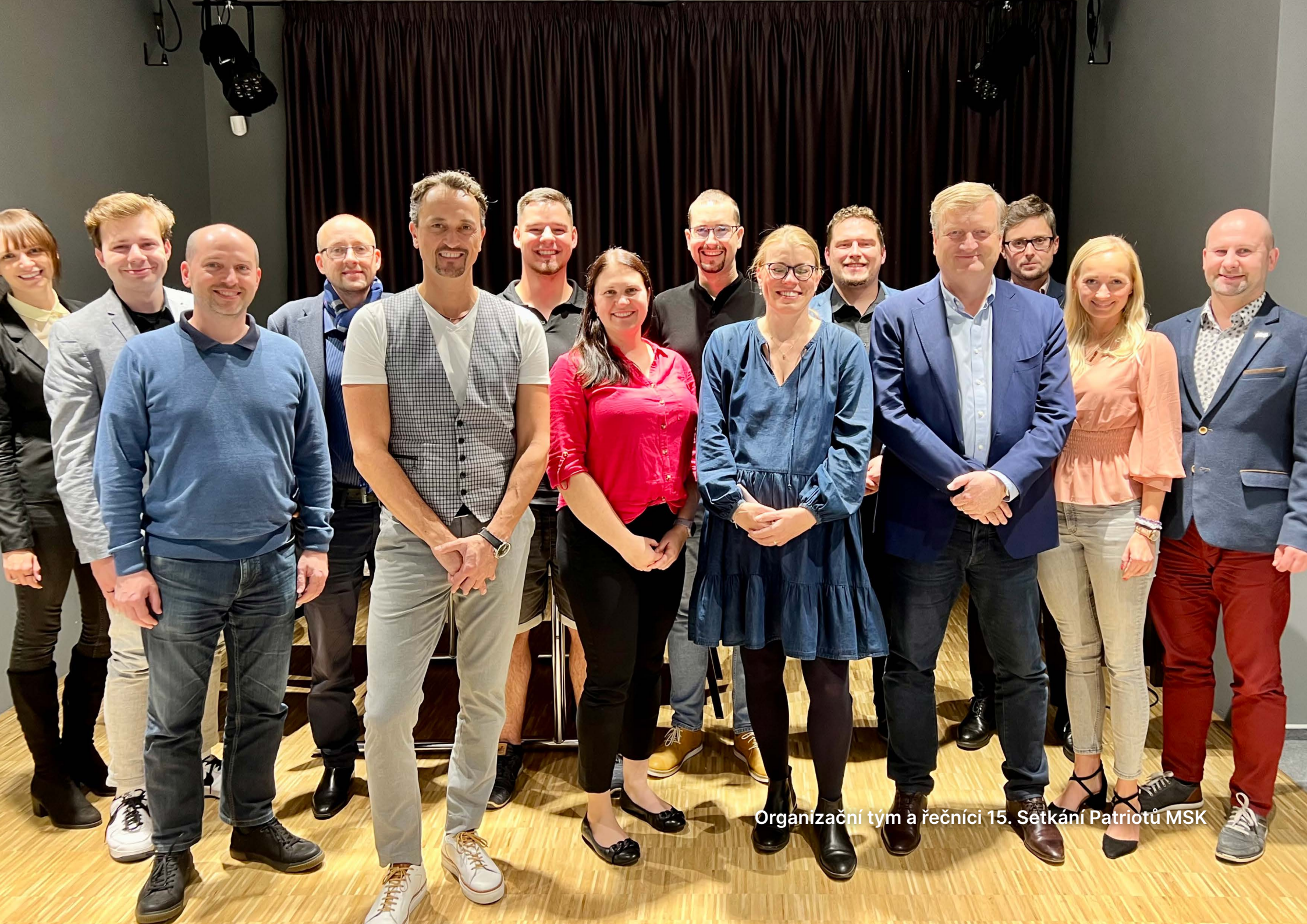
Organizační tým a řečníci 15. Setkání Patriotů MSK