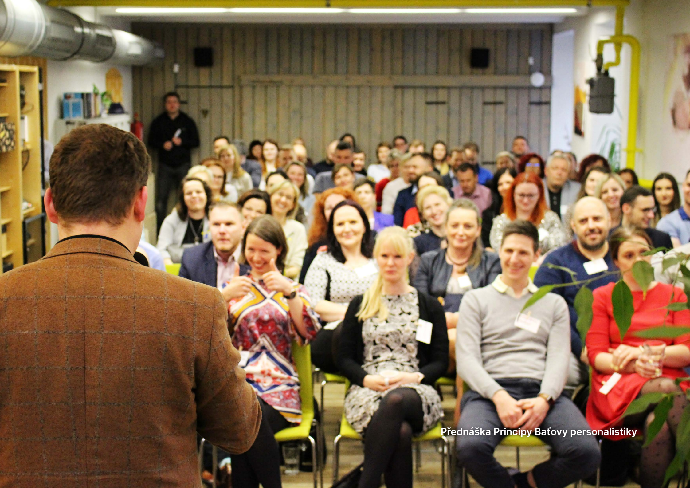
Přednáška Principy Baťovy personalistiky