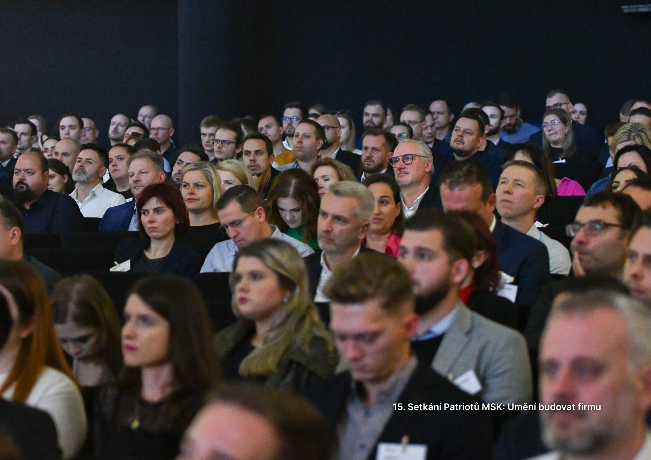
15. Setkání Patriotů MSK: Umění budovat firmu