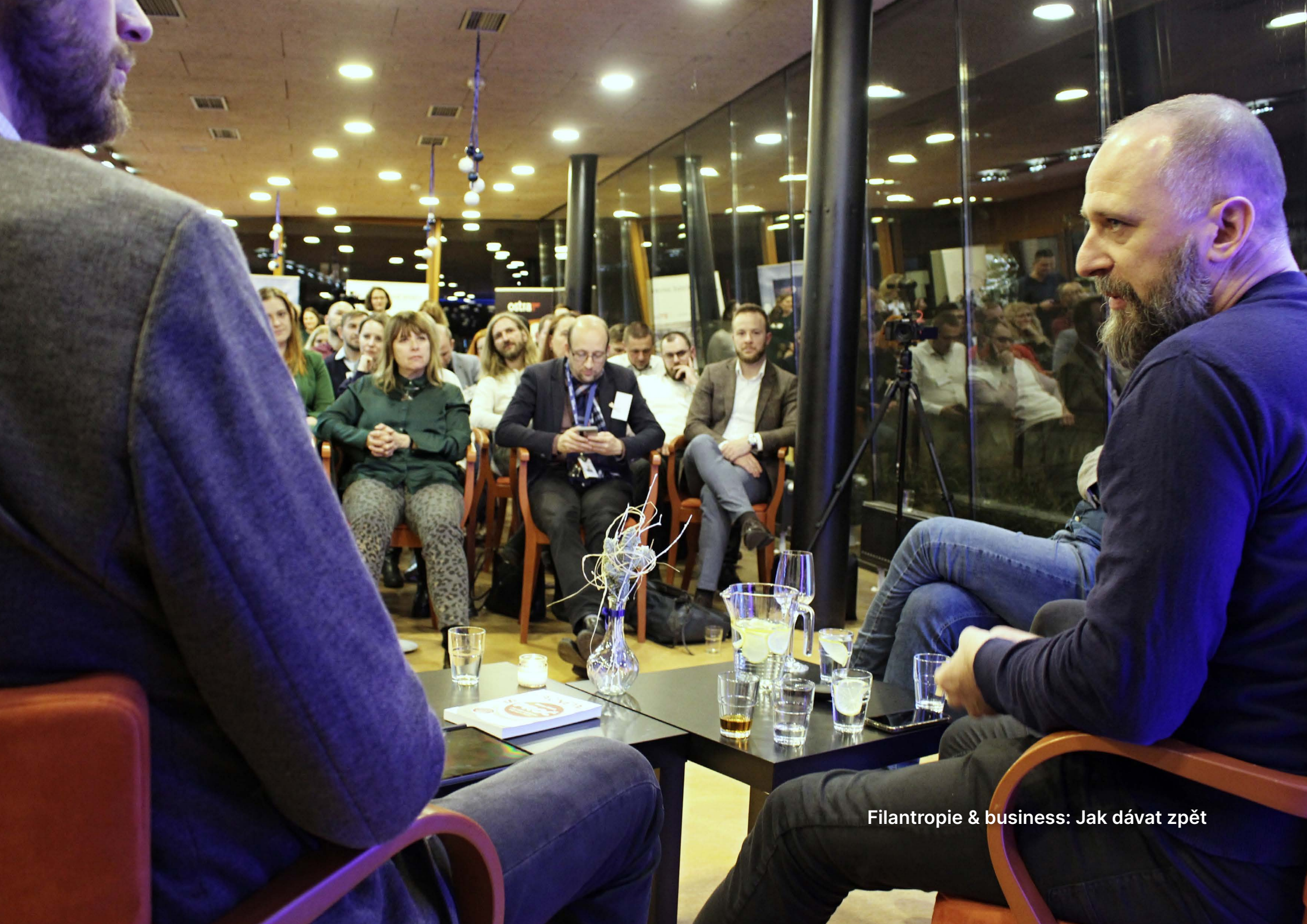
Filantropie & business: Jak dávat zpět